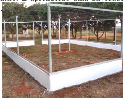
Seja um "Amigo do Cerrado", ajudando o nosso viveiro!